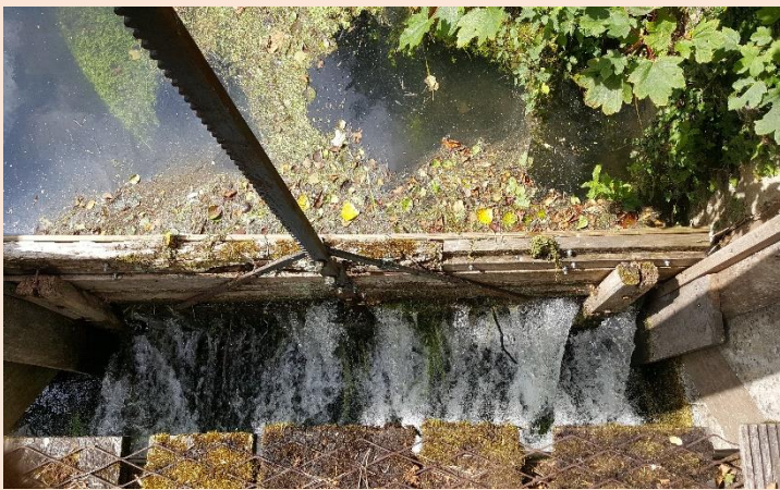
Vannage sans PARÉAU