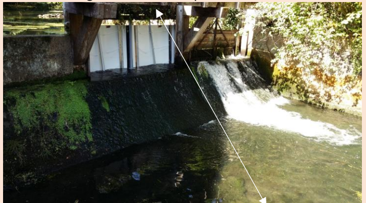
Efficacité PARÉAU / Vannage relevé

Le panneau PARÉAU , breveté, est le seul dispositif à profil galbé convexe (forces latérales de pression d'appui multidirectionnelles qui permet de ne pas avoir recours à des infrastructures de pose). Il permet de bénéficier d'une résistance dynamique et statique optimum aux pressions et aux chocs alors que toutes les offres du marché proposent des panneaux plans qui sont limités en capacité à la pression, et confirmé par les lois physiques élémentaires (pourquoi le profil des barrages hydrauliques est-il galbé ?).