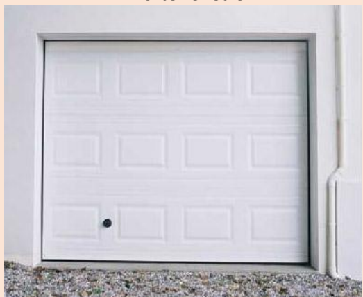
Porte de garage

Face aux phénomènes majeurs du réchauffement climatique, le paréau offre une solution de protection, simple, rapide, légère et sans outils.