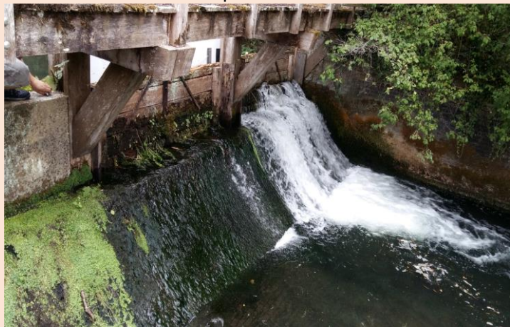
Vannage avec PARÉAU puis sans PARÉAU