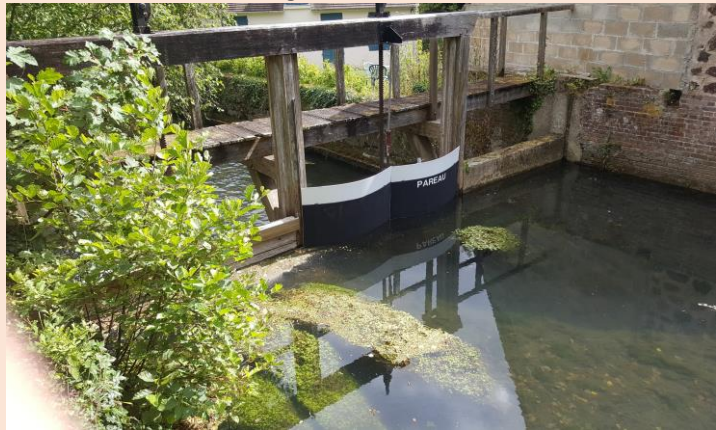
PARÉAU posé sur rivière